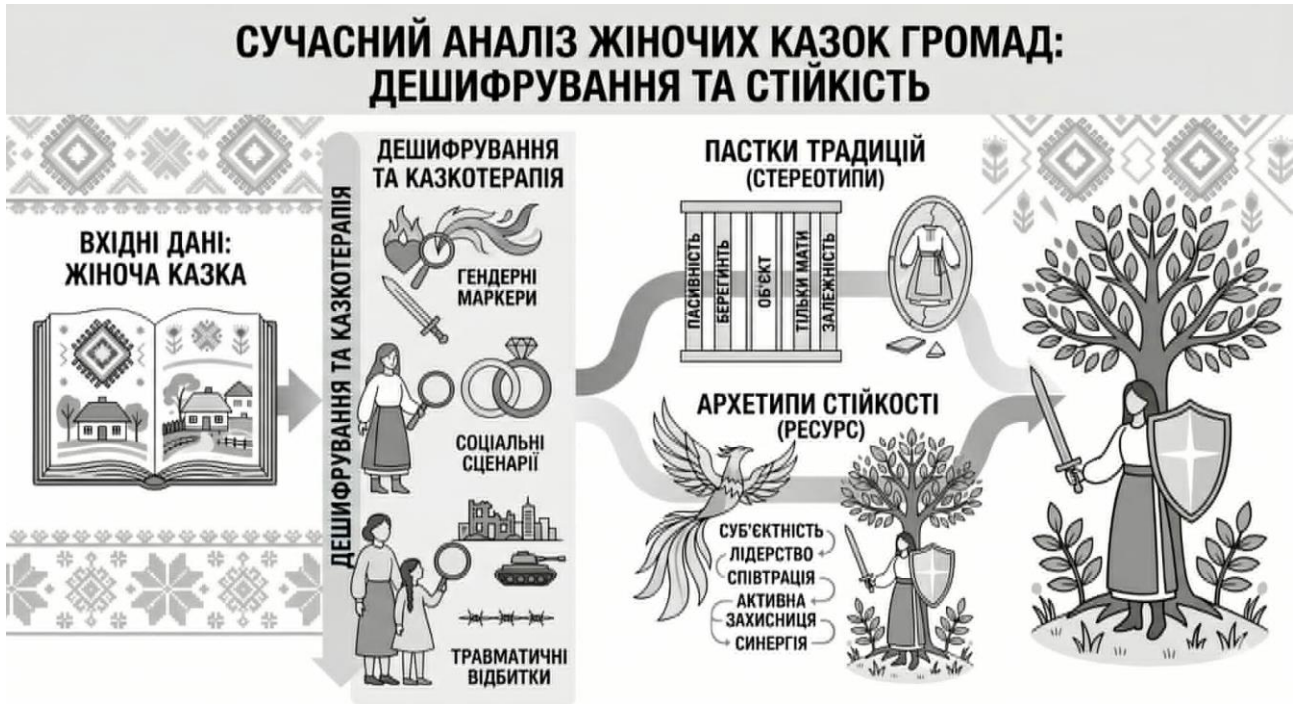
Мал. 1. Сучасний аналіз казок громад: дешифрування та стійкість. Згенеровано ШІ

Кейс № 1. Горохівська ТГ. Метафора «Калини» та дихотомія любові й обов'язку.