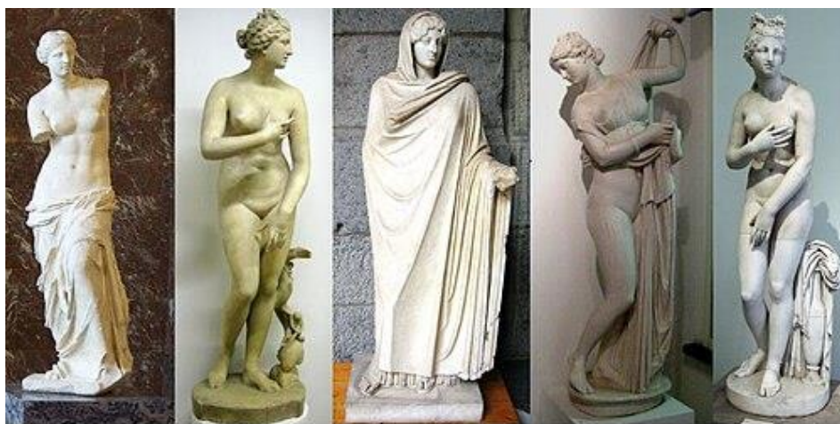
Мал. 1. Скульптури Афродіти

На ідеали краси стародавніх греків значною мірою впливала міфологія та боги, які уявлялися в людській подобі. Одним із найбільш відомих уособлень досконалості в античному мистецтві стала скульптура богині Афродіти (див. мал. 1).