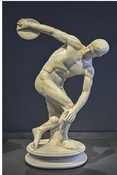
Мал. 2. «Дискобол» Мирона

Античні художники прагнули зобразити тіло у його ідеальних пропорціях, таким чином утверджуючи уявлення про гармонію як основну цінність грецької культури.