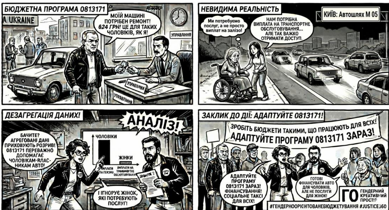
Мал. 1. Ілюстрація підготовлена спільно з III Gemini на запит ГО «Гендерний креативний простір»

4. Програма демонструє тенденцію до сегрегації мобільності. Відсутність індексації виплат приводить до того, що жінки з інвалідністю формально числяться у списках отримувачів допомоги, але фактично залишаються замкненими у власних помешканнях, оскільки сума виплати є малою для реального пересування, що перетворює цю програму на інструмент відтворення гендерної нерівності та соціального виключення найменш мобільних груп населення.